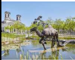
La Roche sur Yon