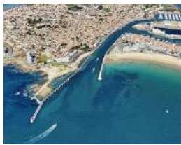
Les Sables d'Olonne