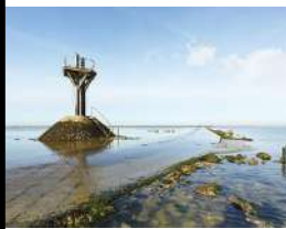
Noirmoutier en l'île