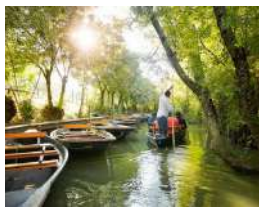
Le Marais Poitevin